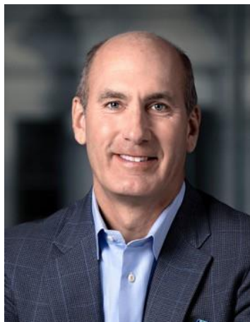
John Stankey, CEO di AT&T

Il nostro scopo in AT&T è offrire alle persone maggiori possibilità tramite competenza, semplicità e ispirazione. Per farlo al massimo livello possibile sono necessari molti talenti, background e prospettive differenti. Tuttavia il requisito fondamentale è l'impegno a favore dell'integrità.